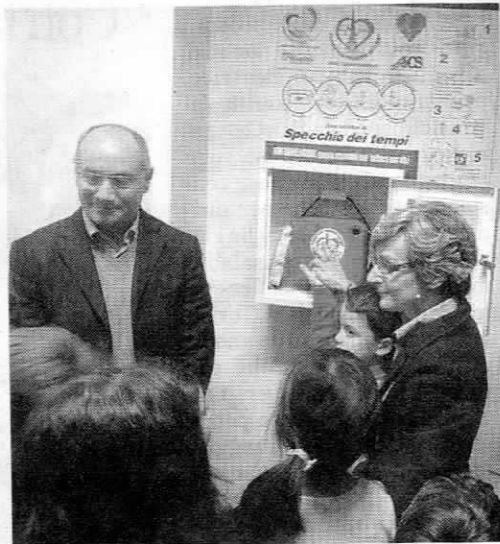
Scuola primaria Andersen, Settimo Torinese