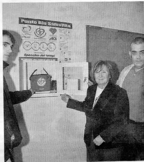
Istituto Albe Steiner, succursale via Monginevro